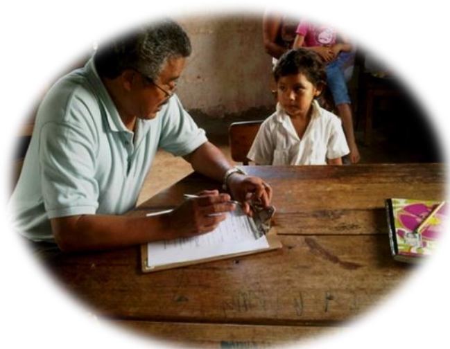
Foto#1. El presidente de la CCT de Santa Rosa de Copán, aplicando la entrevista merienda para niños (as)