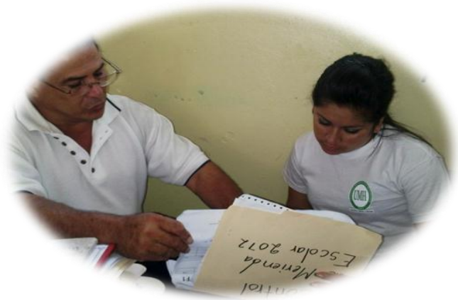
Foto #3. Técnica de la CCT de Santa Rosa de Copán, aplicando la entrevista a Director de Centro Educativo.