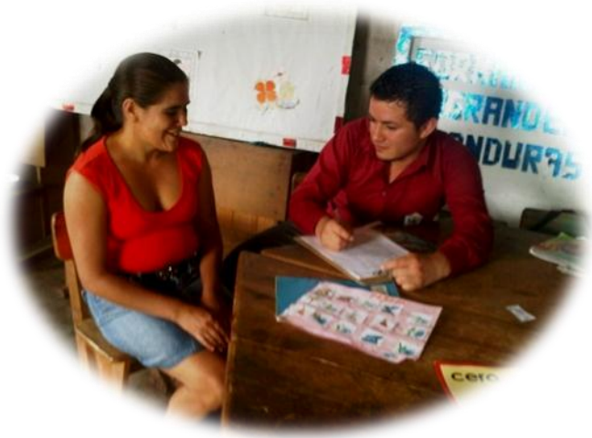
Foto#2. Contralor social aplicando la entrevista de merienda a madre de familia.